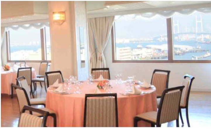
ラメールから横浜ベイブリッジ